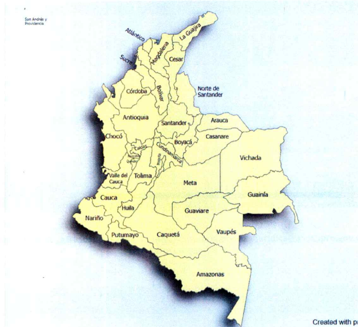
Imagen 1- localización

El lugar de ejecución del contrato, son los Departamentos de San Andrés y Providencia, La Guajira, Atlántico, Córdoba, Cesar, Bolívar, Magdalena, Sucre, Cundinamarca, Caldas, Risaralda, Tolima, Quindío, norte de Santander, Santander, Boyacá, Arauca, Casanare, Meta, Huila, Bogotá D.C., Guaviare, Vaupés, Caquetá, Amazonas, Vichada, Guainía, Chocó, Valle del Cauca, Antioquia, Cauca, Nariño, Putumayo.